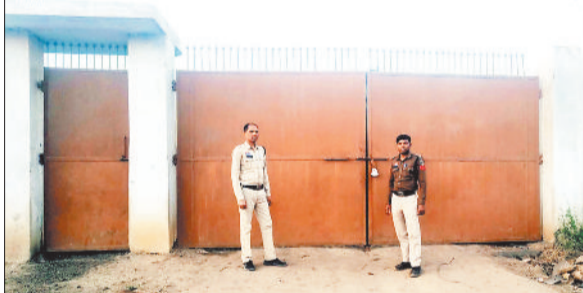
पुलिस ने यार्ड को किया सील।

पिछले कुछ दिनों में कई कबाड़ दुकानों में कार्यवाही की है। वहीं प्रशासन व पुलिस ने बरबसपुर स्थित एक अवैध स्ट्रैप यार्ड में छापेमारी की कार्यवाही की गई। जहां बड़े पैमाने पर वाहनों के कलपुर्जे जब्त किए गए हैं और प्रशासन व पुलिस ने उक्त यार्ड को सील कर