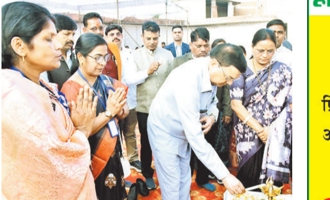
पूर्वा अर्चना करते उद्योग मंत्री एवं महापौर।