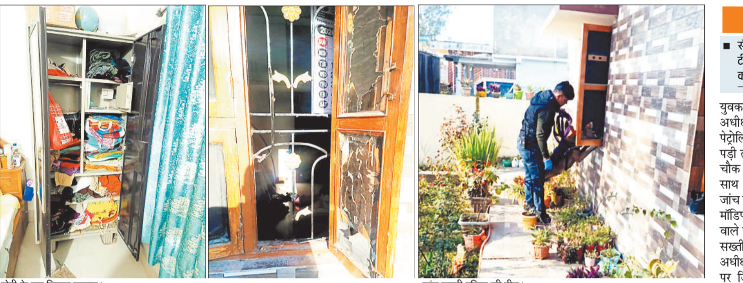
चोरों के बाद बिखरा सामान। जांच करती पुलिस की टीम।

कोरबा। एसबीआई के मैनेजर के घर चोरों का धावा, लाखों के जेवर ले भागे। चोरों ने घर में घुसकर सोने के जेवर, सिक्के, मोबाइल फोन, लैपटॉप और अन्य वस्तुएं चुरा लीं। चोरों का धावा रात के करीब 11 बजे हुआ था। चोरों ने घर के बाहर खड़े गाड़ी को तोड़कर घुसने का प्रयास किया था, लेकिन सुरक्षा बलों की तलाश के बाद चोरों को पकड़ लिया गया। चोरों के साथ चार लाख रुपये के नकद और सोने के जेवर भी बच गए। चोरों को पुलिस ने गिरफ्तार कर लिया है।