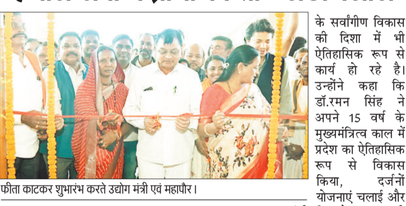
फीता काटकर शुभारंभ करते उद्योग मंत्री एवं महापौर।