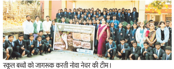
स्कूल बच्चों को जागरूक करती नोवा नेचर की टीम।