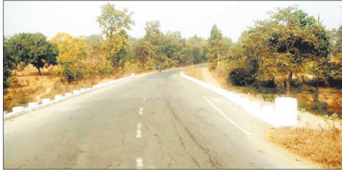
रैलिंगविहीन पुलिया, जहां नहीं लगा है संकेतक बोर्ड।

■ ग्रामीण अंचल के प्रमुख मार्गों में मौजूद हैं मोड़