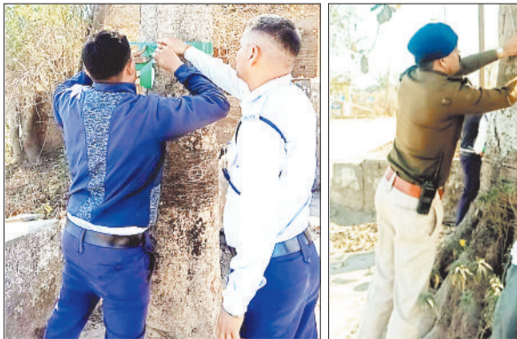
पेड़ पर रेडियम लगाती यातायात पुलिस की टीम।

जिले में बढ़ती सड़क दुर्घटनाओं को रोकने के लिए लगातार यातायात पुलिस काम कर रही है। पुलिस अधीक्षक सिद्धार्थ तिवारी के निर्देश पर पुलिस हादसों को रोकने के लिए तह तरह की उपाय कर रही है। जिसकी वजह से पिछले कुछ वर्षों में सड़क हादसों के ग्राफ में कमी आई है। अब यातायात पुलिस जिले के कुछ मार्गों को चिन्हंकित कर सड़क के किनारे लगे पेड़ों पर रेडियम लगाने की दिशा पर पहल कर रहा है ताकि सड़क पर होने वाले हादसों पर लगाम लगाई जा सके।